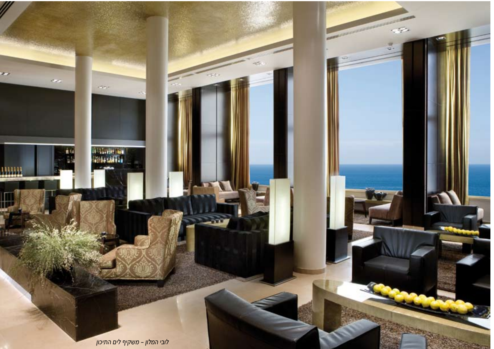
לובי המלון - משקיף לים התיכון

התיכון במלוא הדרה, וסביבכם ספות, כורסאות ושולחנות מזמינים, שרק מרמזים לכם: בואו, שבו והתרועחו.